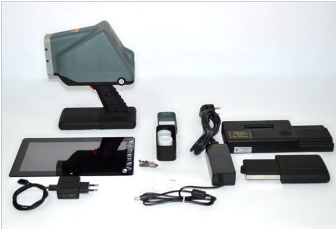
Комплект ПРФА «МетЭксперт»