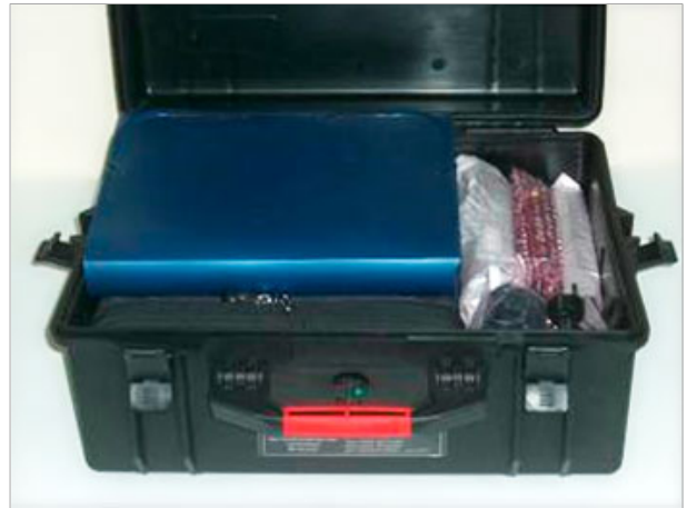
Тара для транспортировки — герметичный ударопрочный кейс